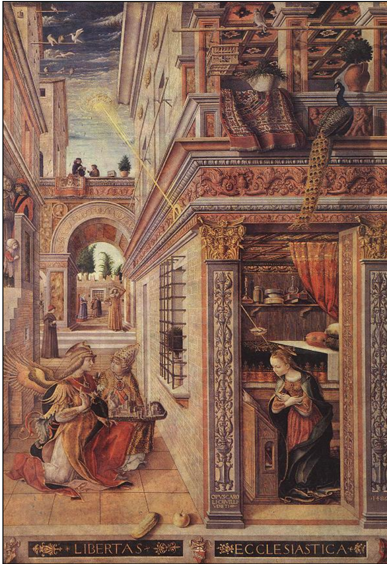
Carlo Crivelli, Annonciation , huile sur toile, 1486