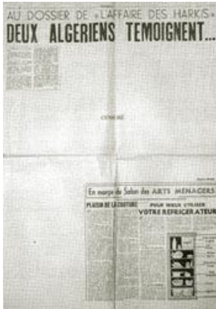
Une du quotidien communiste L'Humanité du 7 mars 1961